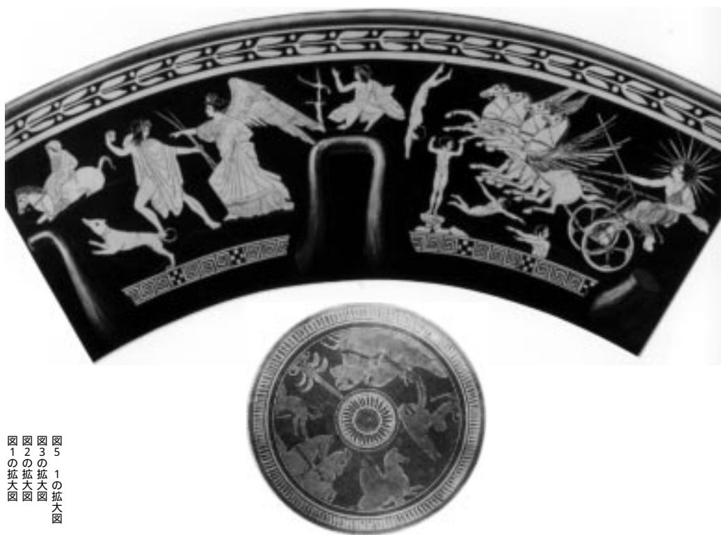
図5 1の拡大図 図3の拡大図 図2の拡大図 図1の拡大図